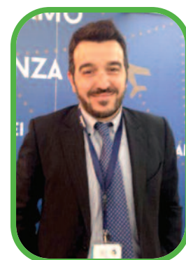
PACCHETTO IL CLUB A RODI

Un investimento anche qualitativo: le rotazioni hanno un ottimo orario, che permette di partire comodamente, per sfruttare al meglio la vacanza.