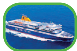
BLUE STAR REGINA DELLE ISOLE

La compagnia Blue Star Ferries, del gruppo Attica, collega la Grecia continentale con le isole e le isole tra loro. Viaggia tutto l'anno con una flotta di 9 navi ultramoderne e dotate di ogni comfort, raggiungendo Creta (in collaborazione con Anek Lines), le Cicladi, le isole del Dodecaneso e quelle dell'Egeo Nordorientale. In combinazione con un viaggio sulla tratta internazionale con Superfast Ferries, Blue Star Ferries applica uno sconto del 30% sulla tratta di andata delle linee domestiche. Inoltre, ai gruppi di 4 persone (4 adulti o adulti con bambini) che viaggia in una cabina bordo dedicati ai più piccoli attua un ulteriore sconto del 25%.