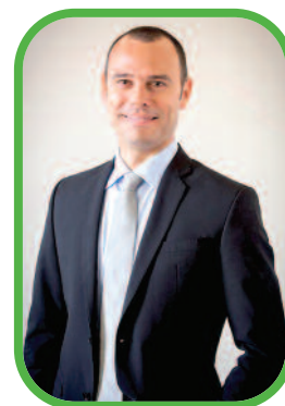
IL CLUB NEL PARCO NATURALE ALLE SPORADI