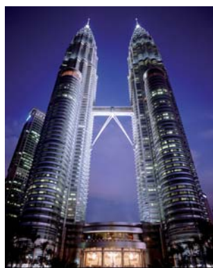
Ministro del Turismo e della Cultura

Dopo l'esperienza positiva del 2007, la Malesia ripropone per il 2014 l'Anno del Turismo e, utilizzando un gergo tipicamente televisivo, rilancia e raddoppia.