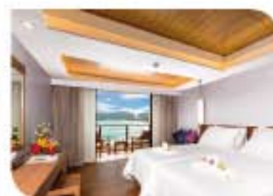
Beyond Resort Karon