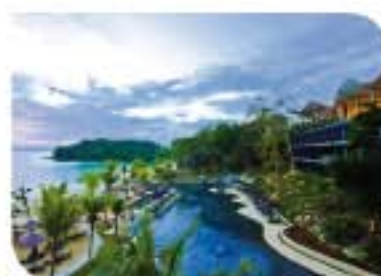
Beyond Resort Krabi