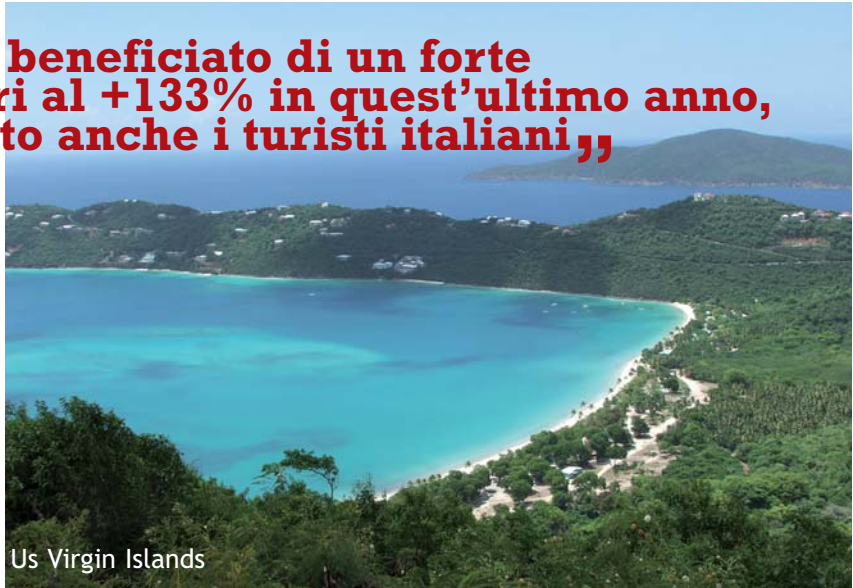
Us Virgin Islands

“Le Isole Vergini hanno beneficiato di un forte incremento di arrivi, pari al +133% in quest’ultimo anno, al quale hanno contribuito anche i turisti italiani,”